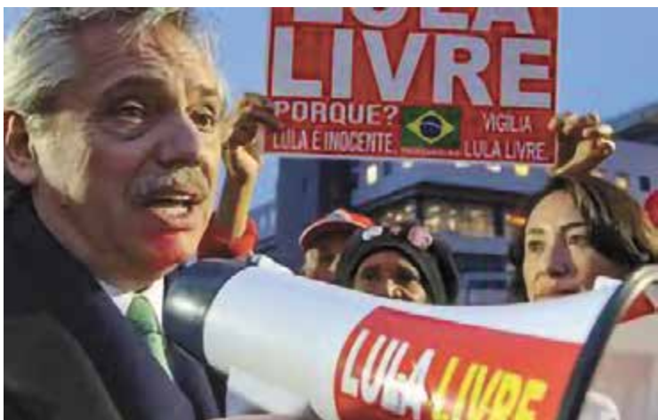
Alberto Fernandez visito el campamento que protegio la integridad de Lula durante su prision.