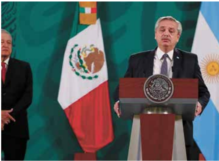
Andrés Manuel López Obrador y Alberto Fernández, en febrero 2021

Ahora, basados en el planteo echo por el Presidente Alberto Fernández, se abre una ventana que, socialmente, no solo a los partidos, sino también a los sindicatos, los profesionales, la cultura la sociedad, los habilita a intervenir y hacer público el entuerto organizado junto a los cipayos internos.