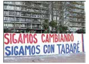
Muro campaña años 2008- 2009