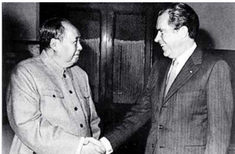
Visita de Richard Nixon a la República Popular China en el año 1972

La cultura general en que se basó el sistema ha sido la insolidaridad social, basada en el derecho individual por sobre el colectivo, ahora es cuestionada como nunca antes, al desenvolverse en el mundo condiciones objetivas revolucionarias, como