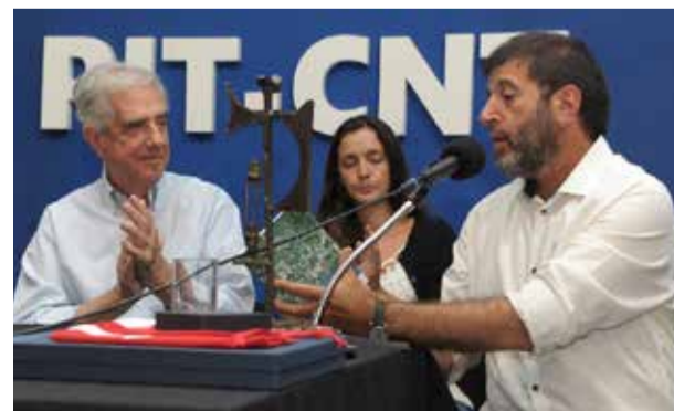
Acto de reconocimiento a la actuación de Tabare Vazquez desde el Gobierno Nacional.

Nosotros vamos a defender y hacer realidad el derecho constitucional de huelga, la negociación colectiva, los puestos de trabajo todos. Vamos a pelear para que el Salario Mínimo Nacional mantenga su poder de compra al igual que los salarios sumergidos. Vamos a luchar por recuperar el poder de compra que se pueda ver disminuido. Venimos de lejos, y vamos lejos.-