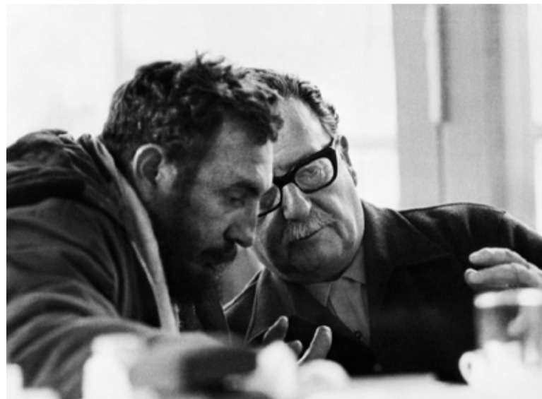
2 de diciembre de 1971: Fidel Castro y Salvador Allende en Santiago

En Rusia, terminó la fantasía de los que la querían ver caer, disolverse el Estado Obrero Soviético, la Unión Soviética, transformado en un país capitalista sometido por la intervención de las transnacionales y la “inversión” de cientos de miles de millones de dólares por el imperialismo. Inmensos montos, nunca simples de probar, menos aún recuperar por “inversionistas”, cuando respondieron a decisiones políticas, además, traídas, durante 10 años, por lo peor de la misma casta burocracia, administradores estatales, mafias oligopólicas etc. que reciclaban capitales, los exportaban hacia el exterior de Rusia, y/o reinvertían en el capitalismo occidental, cuando contaban con mínima confianza en perdurar en aquel “capitalismo de imbéciles”, escribimos en múltiples documentos y algunos libros y folletos publicados por la IV Internacional.