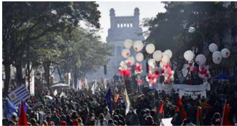
4 de junio 2020, manifestación en Avenida del Libertador

El Frente Amplio, nosotros, no debemos ingresar al nuevo curso electoral, departamental y municipal, partiendo del egoísmo político, la disputa