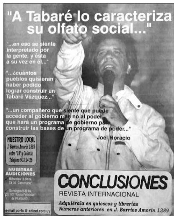
afiche del POR, años 90

Sería un trágico error tratar de tomar como un ejemplo a seguir la política de sostener al Gobierno de Lacalle, tomando ejemplo en la crisis de 2002, en otra condición regional y mundial, cuando el Frente priorizo la defensa de la institucionalidad y el imperialismo mantenía aun capacidad de reacción política y asistencia a los Gobiernos burgueses del momento.