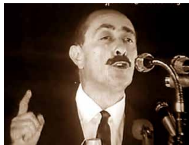
Intervención realizada por Líber Seregní el 26 de marzo de 1971 en nombre de la conducción nacional del Frente Amplio

GRAL. LÍBER SEREGNÍ. * Extractos discurso del 26 de marzo de 1971 Qué se propone el Frente Amplio